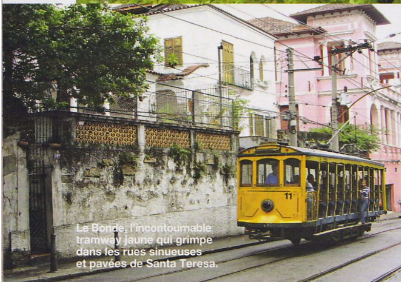
Le Bonde, l'incontournable tramway jaune qui grimpe dans les rues sinueuses et pavées de Santa Teresa.

Surplombant la baie de Rio, la casa Mama Ruisa, superbe demeure des années vingt entièrement remodelée par un Français, accueille des hôtes totalement sous le charme.